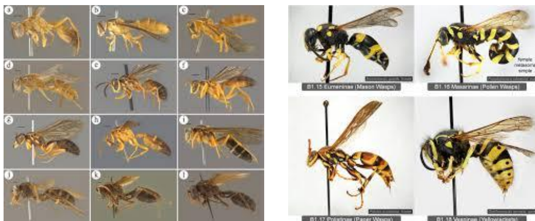
1-rasm. Vespidae vakillari